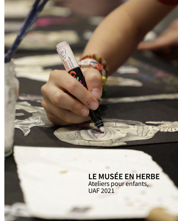
LE MUSÉE EN HERBE Ateliers pour enfants, UAF 2021

Soutenez le cycle de conférences afin d'intégrer votre marque à ces moments de réflexions artistiques et de personnaliser l'espace de talks à vos couleurs.