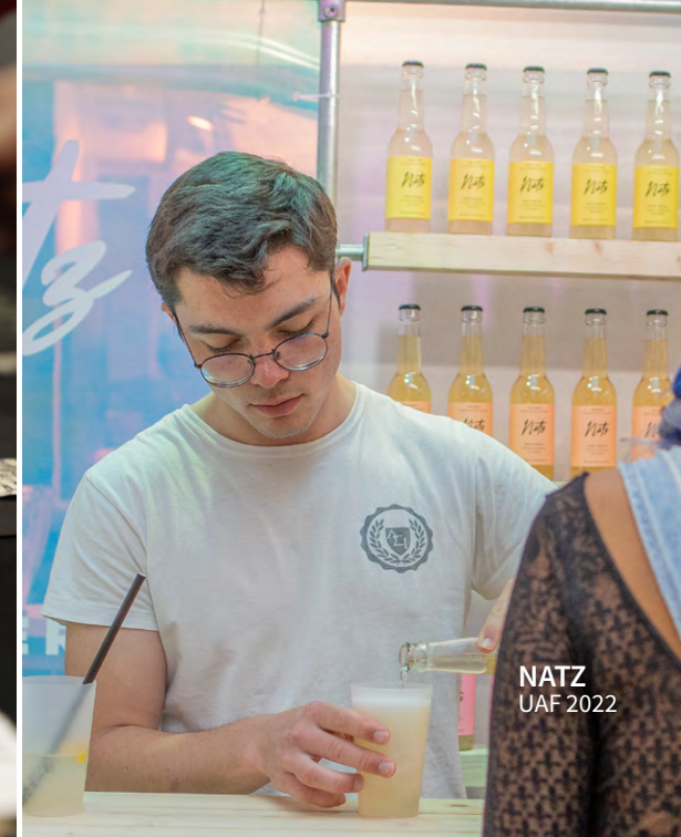
NATZ UAF 2022