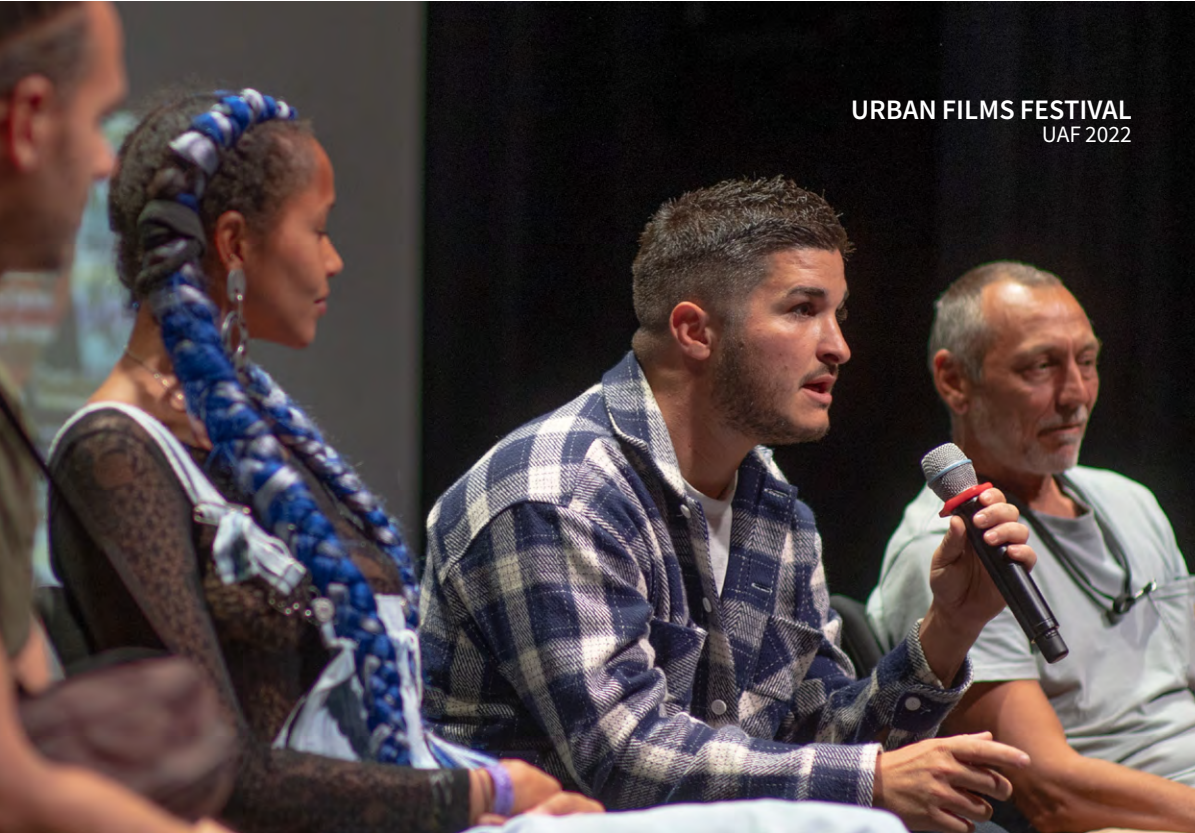
URBAN FILMS FESTIVAL UAF 2022